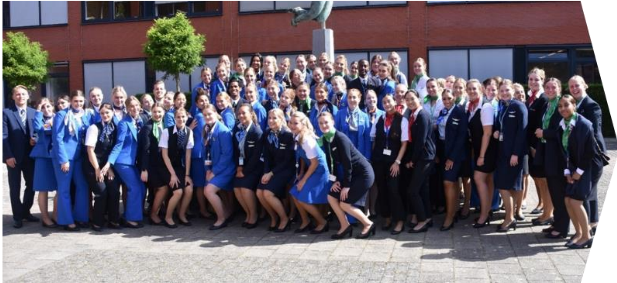
Opleiding Steward / Stewardess