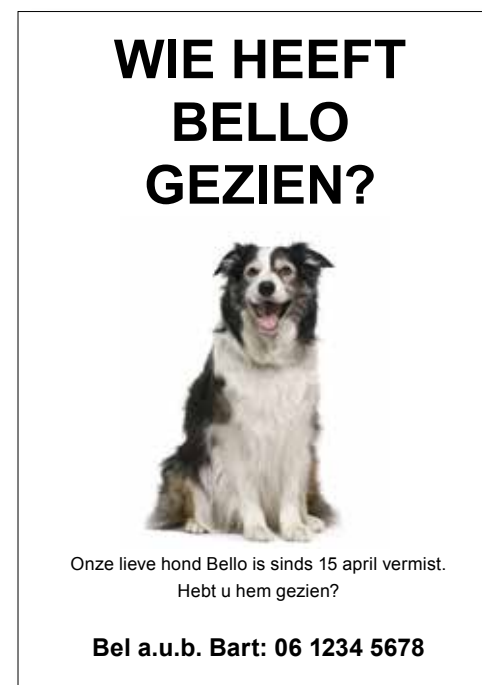
Figuur 1. Flyer over een vermiste hond

Zo'n flyer (zie Figuur 1) kun je in je brievenbus aantreffen, of op een boom in de buurt. De meeste lezers zullen begrijpen wat er met deze tekst wordt bedoeld. Maar om de betekenis op te roepen, moet de lezer wel putten uit een complex van culturele, contextuele en talige kennis. We proberen die kennis van buiten naar binnen – van de culturele context via de tekst naar de afzonderlijke woorden - te expliciteren.